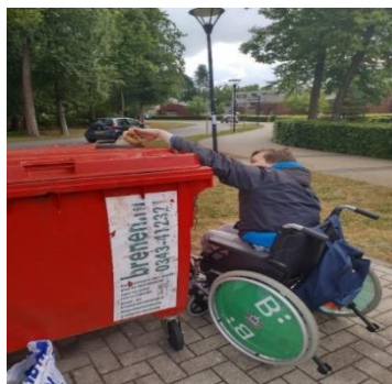
Stage bij de Weegbree