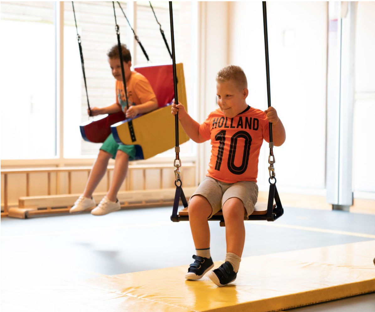
Schommels in de gymzaal.