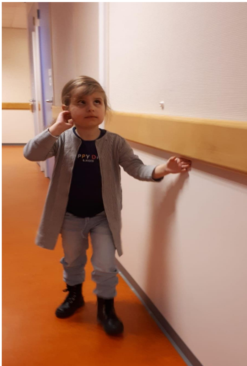
Zelfstandig de weg vinden in school.