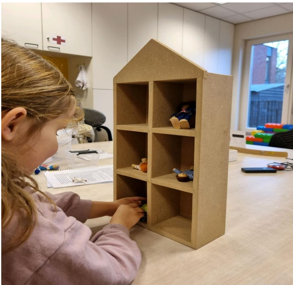
Spelenderwijs braille leren met het braillepoppenhuis