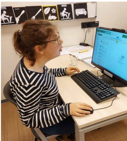
Een leerling aan het werk op de computer.

Op het Bartiméus College gebruiken de leerlingen een laptop en indien nodig kunnen zij een groot beeldscherm gebruiken in het klaslokaal. Ook leren zij met en van lesboeken en faciliteiten die op het schoolnetwerk staan. Opdrachten die leerlingen maken sturen zij per e-mail naar de docent of worden door de leerling afgedrukt. Er is ook een draadloos netwerk beschikbaar voor zelf meegebrachte apparatuur van leerlingen en medewerkers. Zo kan iedereen gebruik maken van tablets en smartphones.