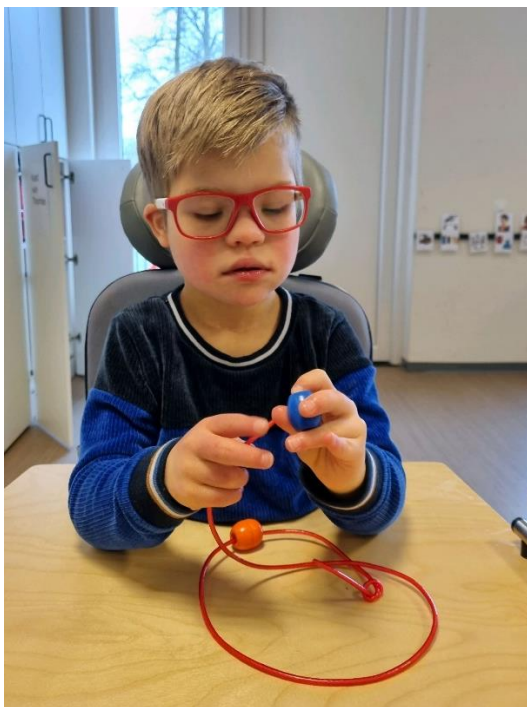
Werken in de klas

Mocht zich een calamiteit voordoen in het een schoolvakantie, bel dan het calamiteitenummer onderwijs 088 88 99 8 99.