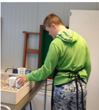
Stage bij Catering Boschwijk

Uiteraard is er een mogelijkheid om een stageplek bij u in de buurt te zoeken. Onze stagecoördinator begeleidt leerlingen tijdens hun stageperiode en bereidt hen voor op de overgang naar dagbesteding. Samen met ouders/verzorgers en de maatschappelijk werker wordt gezocht naar een passende werkomgeving. In een enkel geval komt een leerling in aanmerking voor een sociale werkvoorziening. De maatschappelijk werker of de medewerker van MEE (cliëntondersteuning) kan u begeleiden bij het aanvragen van indicaties of een uitkering. Meer informatie over de stageplekken en toekomstige werkplekken van Bartiméus vindt u op Dagbesteding Bartiméus .