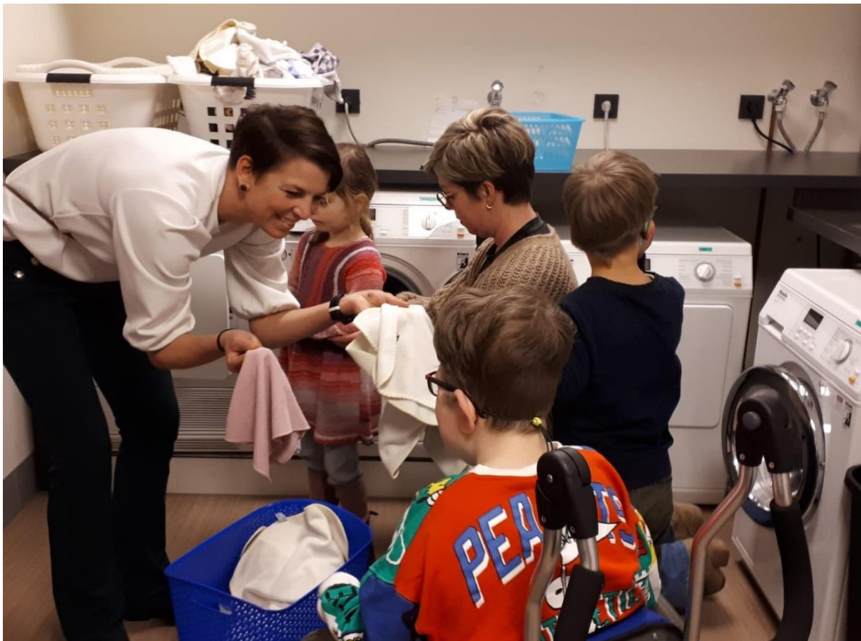
Samen de was doen.