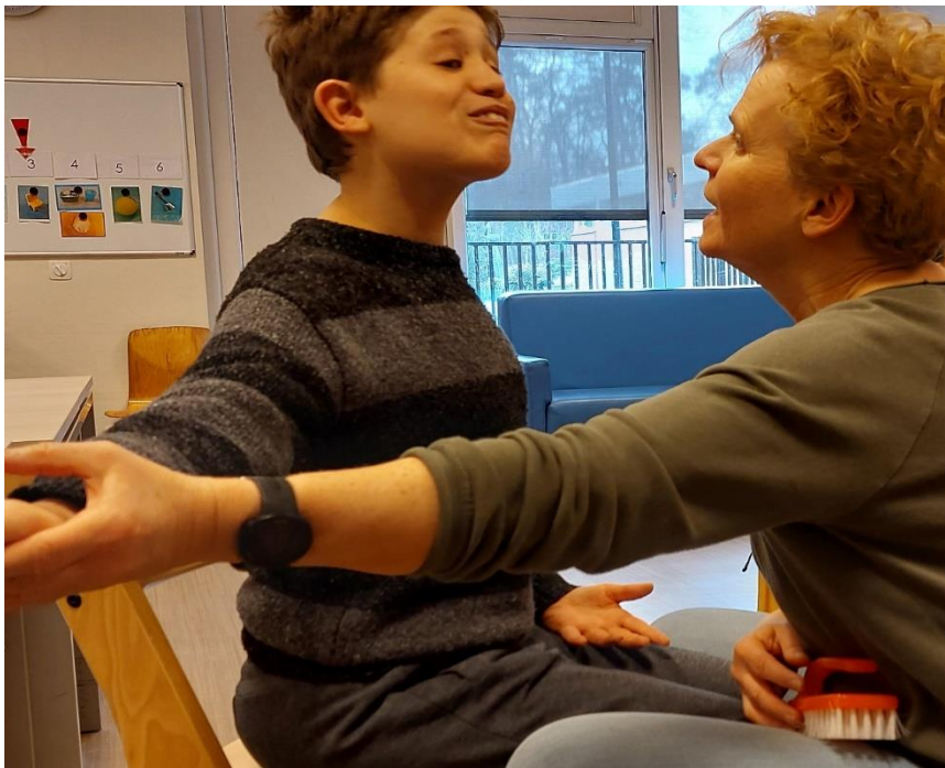
Samen leren en oefenen.