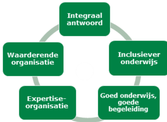
Figuur 1: Schoolplandoelen

Onze meerjarige doelen (2023-2027) hebben wij opgenomen in het instellingsplan Bartiméus Onderwijs 2023-2027 (te vinden onder het kopje 'Documenten').